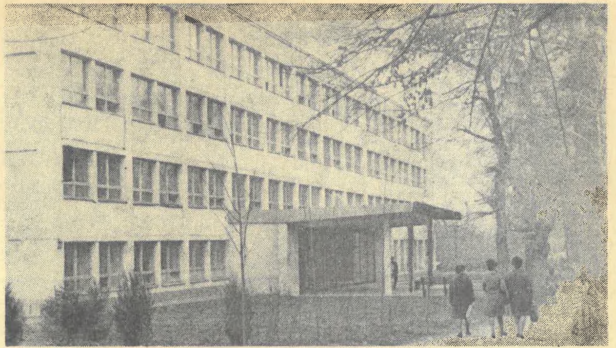
Учебный корпус филологического и механико-математического факультетов. Это новое светлое и просторное здание выросло на пересечении улиц Кирова и Масанчи.