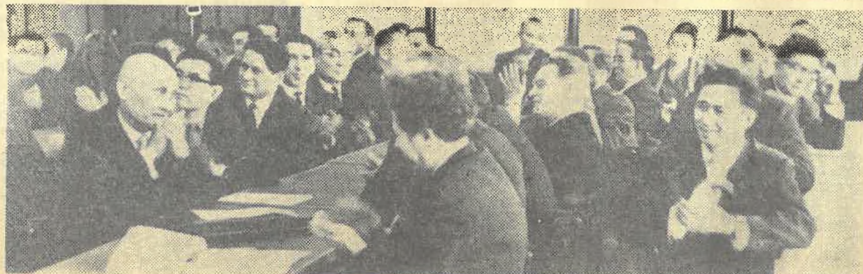
Защита кандидатской диссертации членом Верховного суда Казахской ССР ВАЛИЕВЫМ М.