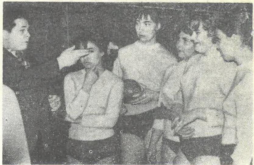
Идут занятия в секции ручного мяча.

После подведения итогов полагается дать их на подпись главному судье. Но вот беда, место главного судьи оказалось вакантным. А не подойдет ли для этой роли общественное мнение? Г. ИВАНОВ.