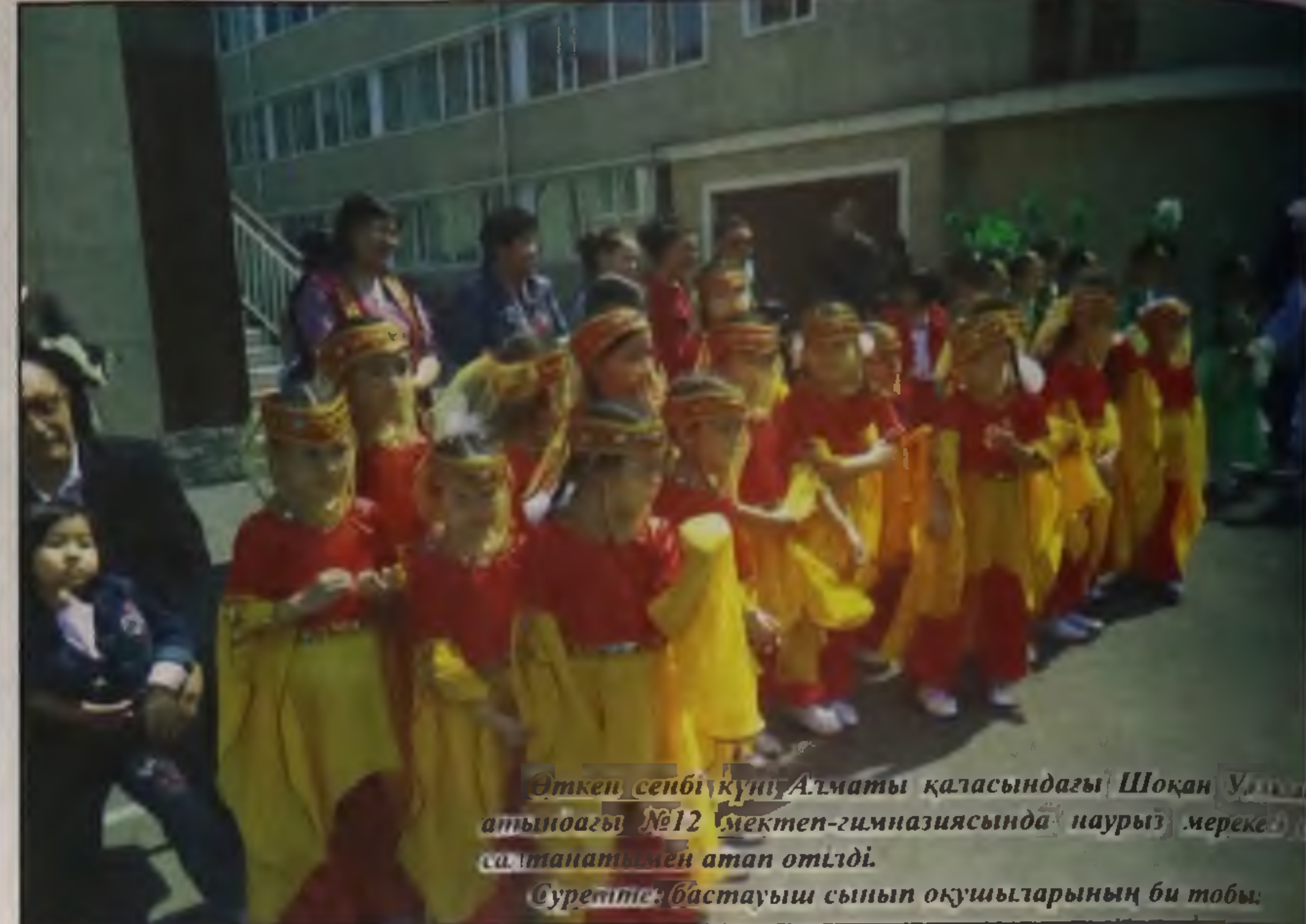
Өткен сенбі күні Алматы қаласындағы Шоқан Уәлиханов атындағы №12 Бектеп-гимназиясында наурыз мерекесіне арналған концерт аяқталды.