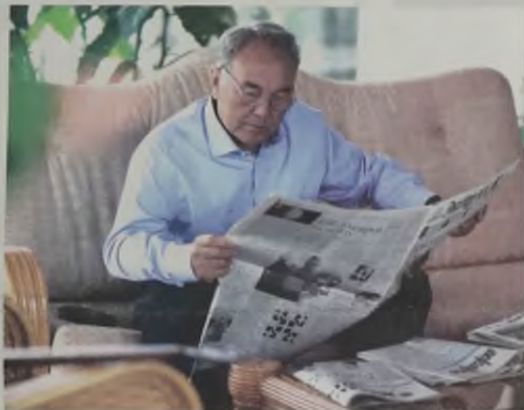
Коллективу ежедневной общественно-политической республиканской газеты «Экспресс К» Поздравляю коллектив общественно-политической республиканской газеты «Экспресс К» со 100-летним юбилеем!

Сегодня – новость, завтра – история www.express-k.kz