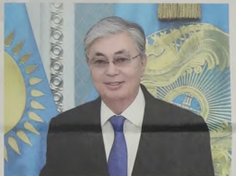
Уважаемый коллектив газеты «Экспресс К»! Поздравляю вас с юбилеем – 100-летием со дня выхода первого номера газеты!

Первый Президент Республики Казахстан – Елбасы Нурсултан Назарбаев