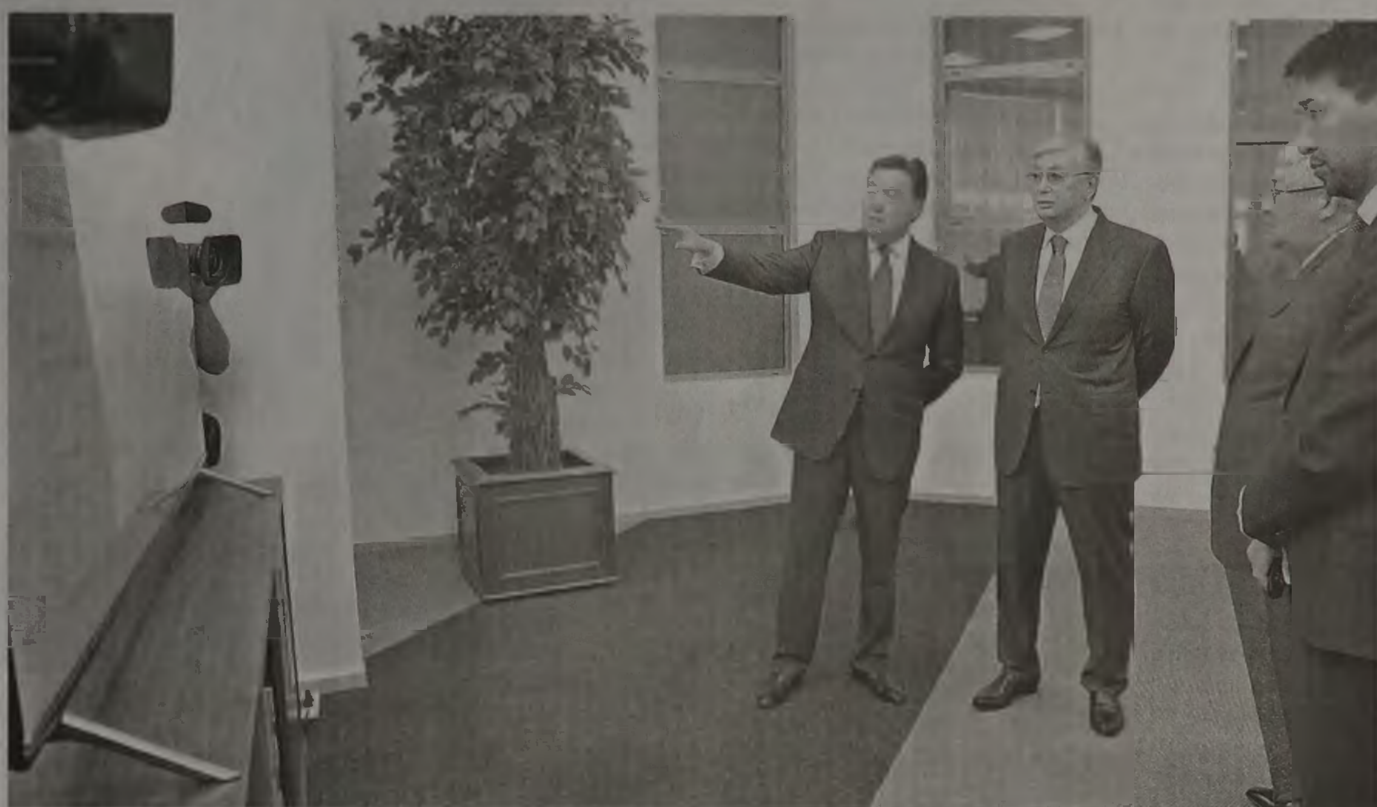
Сурет: Президенттің басшысы Қасым-Жомарт Тоқаевтың алымы

Мемлекет басшысы тағы бір маңызды бағыт ретінде кәсіпкерлікті қолдауға маңыз берді. Бұл мәселе жақында ғана Ұлттық инвесторлар кеңесінде талқыланды. Қасым-Жомарт Тоқаев осы орайда отандық бизнесті толық қолдайтынын білдіріп, кәсіпкерлердің жолына көлденең тұрып, негізсіз тексерулермен матап, алымдармен қанап, рейдерлікпен айналысатындарды қатаң жазалау керектігін айтты. Сонымен қатар бизнеске кедергі келтіретін мемлекеттік органдар мен олардың басшыларын қылмыстық жауапкершілікке тартудың уақыты туғанын мәлімдеді.