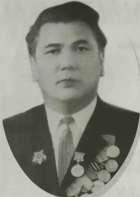
ӨЗ ҚОҒАМЫНЫҢ АЙНАСЫ