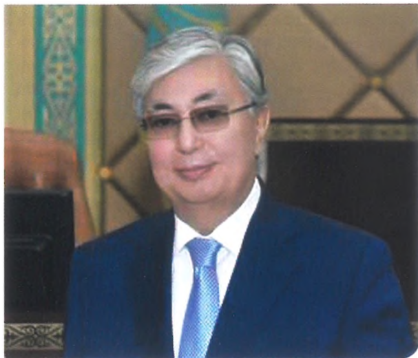
Қасым-Жомарт ТОҚАЕВ Қазақстан Республикасы Парламенті Сенатының Төрағасы