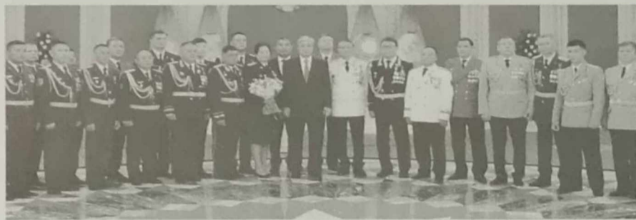
(Жалғасы. Басы 1-бетте).