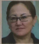
Маржан ӘКІМЖАНОВА Қазақстан Республикасы Президентінің кеңесшісі қызметіне тағайындалды