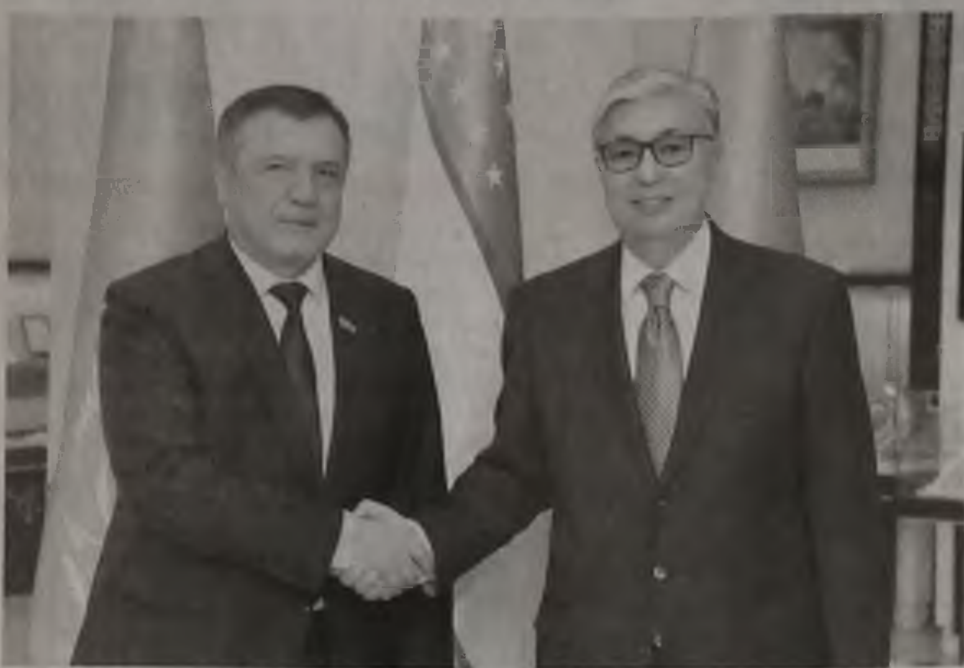
Сенат төрағасы Қасым-Жомарт Тоқаев Өзбекстанның Олий Мажлис Заң шығару палатасының төрағасы Нурдинжон Исмоиловпен кездесіп, келіссөз өткізді. Қ.Тоқаев Қазақстан мен Өзбекстан басшыларының күш-жігерінің арқасында екі ел арасындағы қатынастар соңғы жылдары жаңа қарқынға ие болғанын атап өтті.

«Елдеріміздің белсенді ынтымақтастығы және бүкіл Орталық Азияның табысты экономикалық дамуы, тұрақтылығы мен қауіпсіздігі Қазақстан мен Өзбекстанның халықаралық аренадағы өзара іс-қимылына байланысты», — деді Жоғарғы палата төрағасы.