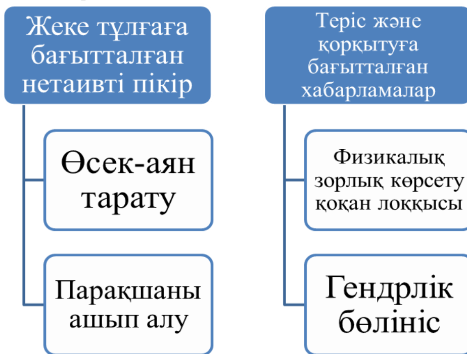
4 - сурет

– Тағы да үлкен маңызға ие мәселе кибермоббингтік әрекеттердің гендрлік сипатқа ие болуы. Жүргізілген зерттеулерге сәйкес, қыз балалардың 61% осындай шабуылдарға ұшырайды, ер балалардың 39% негативті ғаламтор әрекеттеріне бейім болады екен. Ал кей зерттеушілердің пікірінше, бұндағы пайыздық көрсеткіш мүлде қарама қарсы, ал үшіншілер ешқандай айырмашылықтың жоғын көрсеткен, яғни, кибермоббингтік әрекеттердің құрбандары ешқанда гендрлік сипатқа ие емес, сәйкесінше, бірдей қорғану мәселелерін ойластырған жөн.