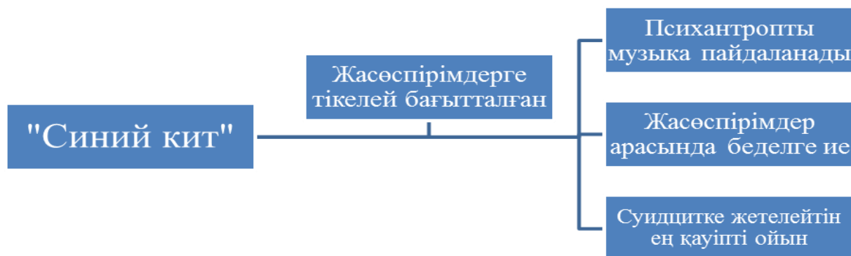
5 - сурет

әрекетін тоқтатпайтынын жеткізді. Ол ресми түрде қамауға алынғанымен, оның ізбасарлары оның жолын жалғастыруда. Бұған түрлі себептер бар, аса үлкен аудиторияны құрайтын адамдар, яғни, танымалдылық принципі, финанстық пайдалы нәтежиелер неғұрлым көп қолданушысы болған сайын соғұрлым PR агенттіктері осындай топтарды қаржыландыру арқылы үлкен мотивация беріп отырады, сондай ақ, үлкен саяси факторды ұмытпаған жөн, белгілі елді жаулау үшін оның жастарын улау бұл үлкен политтехнология болып табылады.