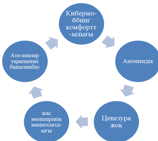
1 – сурет

Ғаламтор дамуы барысында қоғамның түрлі топтарын әлеуметтендіру мүмкіндігіне ие болды. Қолданушылардың жас көрсеткішінің шектелмеуі, ақпараттың сақталу мүмкіндігінің жоғары сипаты және анонимдіктің кепілденуі, түптеп келгенде, кибермоббингтік әрекеттерге жастардың тез икемделуіне әкеліп тірейді. Ендігі жерде, сол негативті және теріс берілген ақпараттың жоғары дәрежеде таралуы мен оның практикалық тұрғыда жылдам іске асуына қозғау салып, катализатор рөлін атқаратын функциялардың негізіне тоқталайық. Бастысы одан қорғанудың да жолдарын ұмыт қалдырмайық (1-сурет).