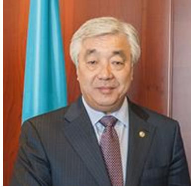
ЕП, г-н Ерлан Идрисов, Министр иностранных дел Республики Казахстан

21 октября в Министерстве иностранных дел Республики Казахстан проходил брифинг о выдвижении кандидатуры Казахстана на непостоянное членство в Совет Безопасности ООН. В ходе брифинга ЕП, г-н Ерлан Идрисов, министр иностранных дел Республики Казахстан также сделал несколько комментариев по африканской повестке. Он сказал, что во время 70-й годовщины Генеральной Ассамблеи ООН, правительство Казахстана и ПРООН подписали соглашение на $ 2 миллиона долларов США для нового проекта "Африко-Казахстанское партнерство для целей устойчивого развития (ЦУР)". Инициатива направлена на техническую поддержку министерств иностранных дел и других соответствующих учреждений в 45 странах Африки. Проект будет способствовать обмену институциональным опытом и передовой практикой, поскольку правительства готовятся к реализации новой глобальной повестки 2030.