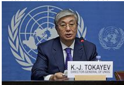
Председатель Сената г-н Касым-Жомарт Токаев

В этом году Организация Объединенных Наций отмечает 70-летний юбилей. Казахстан также отмечает данное событие, чтобы отдать дань истории создания и деятельности организации в развитии сферы безопасности и прав человека. С начала года был проведен ряд мероприятий, посвященных юбилею.