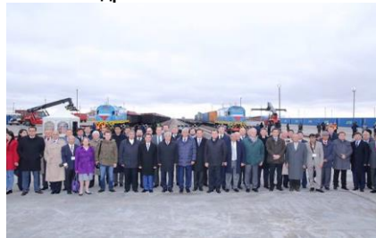
Министр иностранных дел Республики Казахстан, ЕП г-н Идрисов и главы миссий на церемонии открытия

19 октября 2015 года Посол Южноафриканской Республики ЕП г-н Ш. Сони посетил объекты свободной экономической зоны «Восточные Ворота» Хоргос и Хоргосский Международный центр приграничного сотрудничества. Тур был проведен с участием г-на Е. Идрисова, министра иностранных дел Республики Казахстан и акима Алматинской области, г-на А. Баталова.