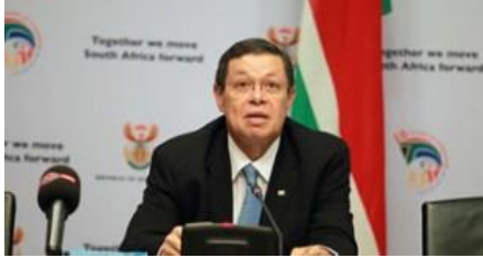
Заместитель министра международных отношений и сотрудничества, г-н Люэлин Ландерс

Южная Африка всегда стремится к взаимовыгодному сотрудничеству в своих международных обязательствах, пишет автор